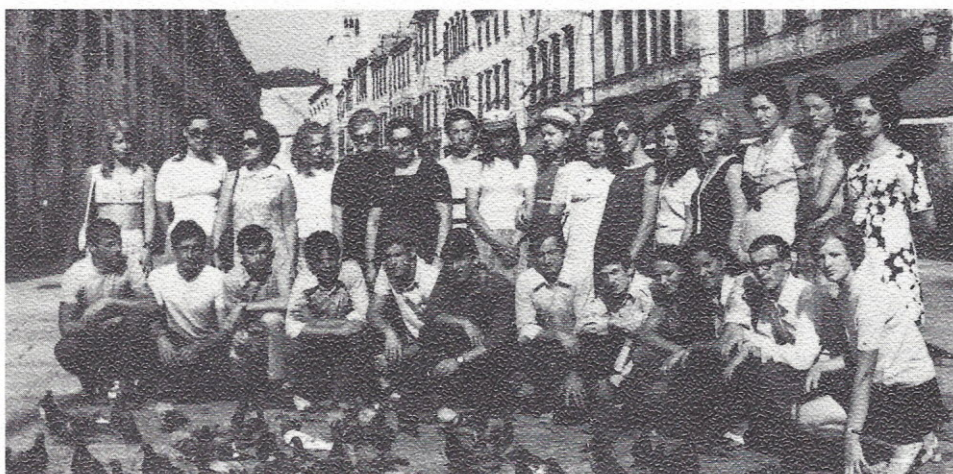
Na maturantski ekskurziji v Dubrovniku 1970/71