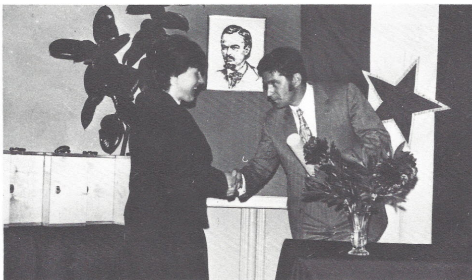
IMP-Ljubljana je prevzelo pokroviteljstvo nad gimnazijo Josipa Jurčiča

Dijaki in delovna skupnost gimnazije poskušajo vračati dolg po svojih sposobnostih. Predvsem ob državnih in drugih praznikih prirejajo kulturne in zabavne programe za delavce svojega pokrovitelja. Upamo pa tudi, da se bodo mnogi dijaki odločili za tako smer študija, da bodo lahko opravljali svoje poklice v različnih TOZD IMP. Veseli smo, da se obojestranski odnosi lepo