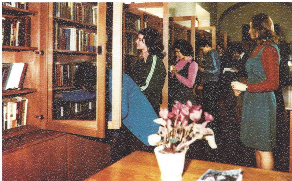
Med knjižnimi policami

V sklopu OZD IMP Ljubljana deluje tudi TOZD Livarna Ivančna gorica. Ta kolektiv je v zadnjih letih napravil največji napredek od vseh TOZD v OZD IMP Ljubljana. Pred nekaj leti še neznana livarna spada danes po svoji sposobnosti in tehnični opremljenosti v sam vrh livarske industrije v Jugoslaviji. Svoje proizvode že tri leta uspešno izvažata na Švedsko, v Zahodno Nemčijo in Italijo. Z željo nenehnega napredka in uvrščanja med napredne svetovne livarne je ta 230-članski kolektiv že leta 1972 začrtal svojo perspektivo za naslednjih nekaj let.