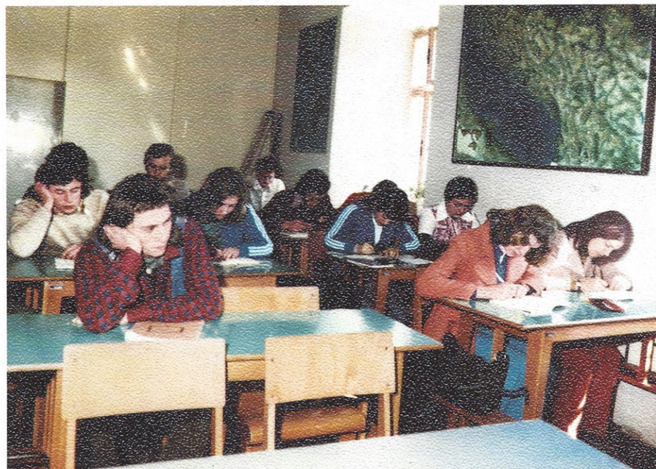
Pri pouku zgodovine