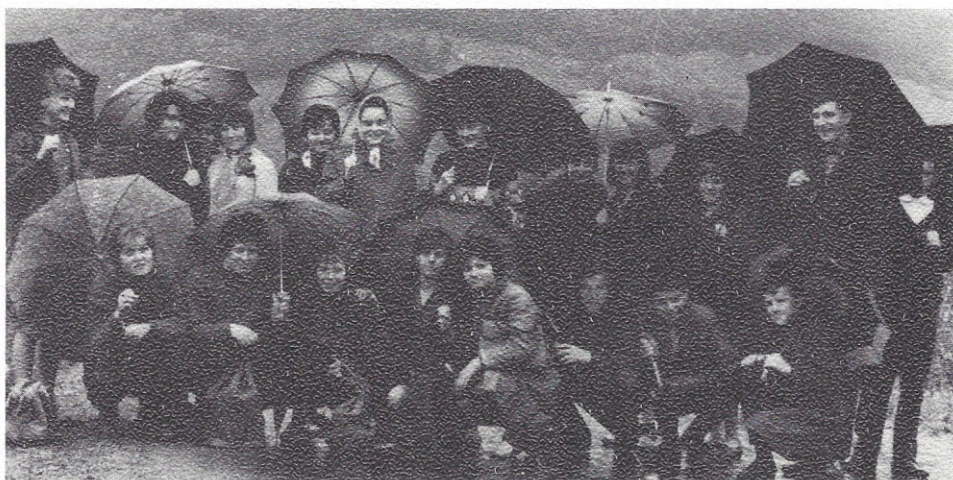
Mladost pod dežniki — prvi razred v šolskem letu 1964/65