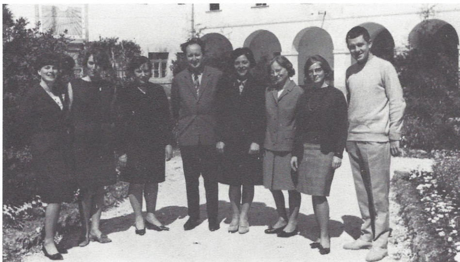
Profesorski zbor v šolskem letu 1966/67

954—1955 950—1952 948—1952 972 dalje 968—1969 973—1974 945—1958 955—1955 955—1964 972 dalje 945—1945 960—1961 964—1971 964—1965 974 dalje 968—1959 975 dalje