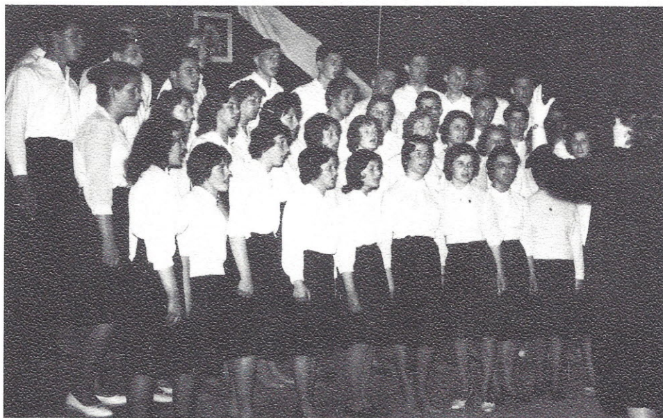
Na reviji mladinskih pevskih zborov 1961