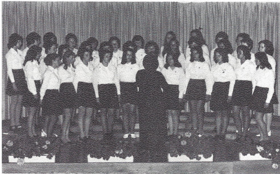
Dekliški pevski zbor na V. kulturnem tednu v Šentvidu