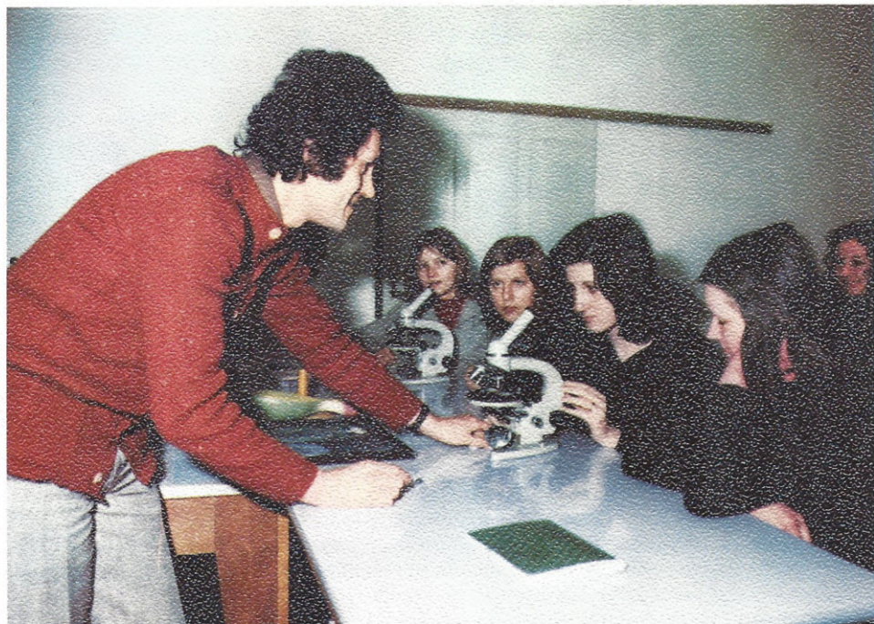
Mikroskopiranje — mikroskopi so darilo Livarne IMP