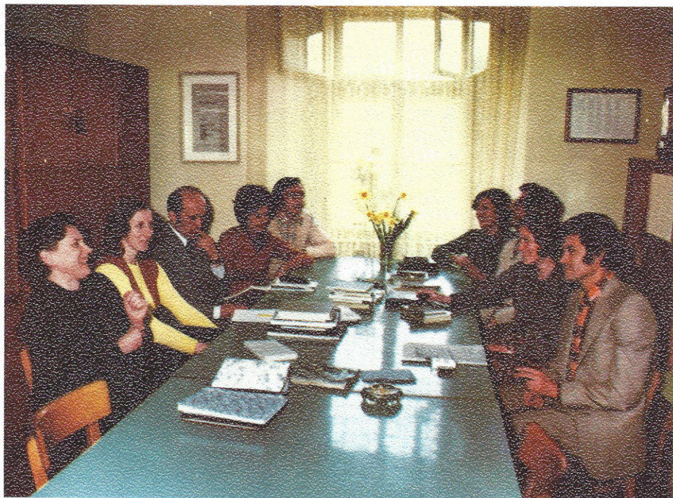
Profesorski zbor v šolskem letu 1974/75