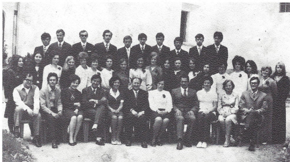
Maturanti in profesorji v šolskem letu 1970/71