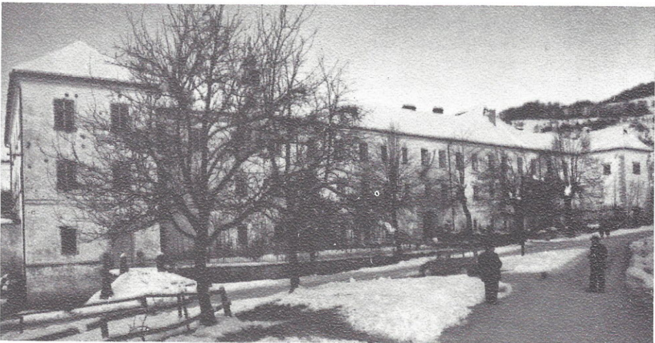
Poslopje, kjer ima v pritličju in prvem nadstropju prostore gimnazija Josipa Jurčiča

V šolskem letu 1972/73 je gimnazija prešla v celoti na kabinetni pouk, kar je pomemben prispevek k posodobljenemu pouku. Imela je šest oddelkov in 149 dijakov, v naslednjem letu pa sedem oddelkov in 173 dijakov. V tem letu je pripravila nov statut in z njim uredila širše sodelovanje javnosti z delom šole, saj je dobila svet gimnazije, v katerem so poleg članov delovne skupnosti še zastopniki dijakov, staršev, organizacij združenega dela in krajevnih skupnosti (skupaj 20 zunanjih članov). Ustanovila je tudi svojo osnovno organizacijo sin-