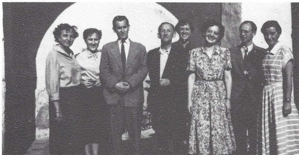
Maturitetna izpitna komisija 1. 1957