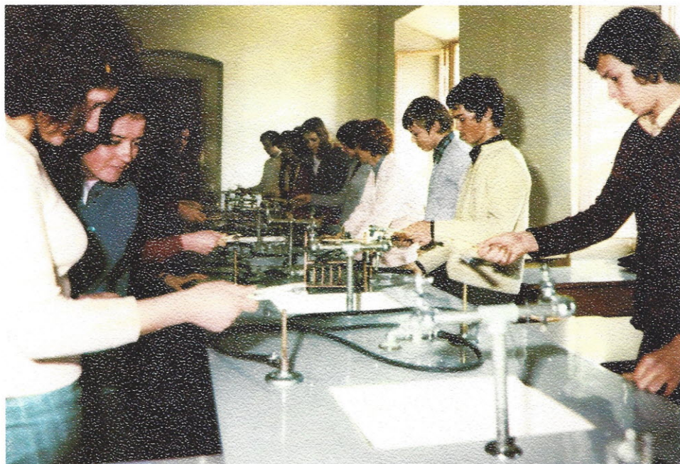
V laboratoriju za kemijo