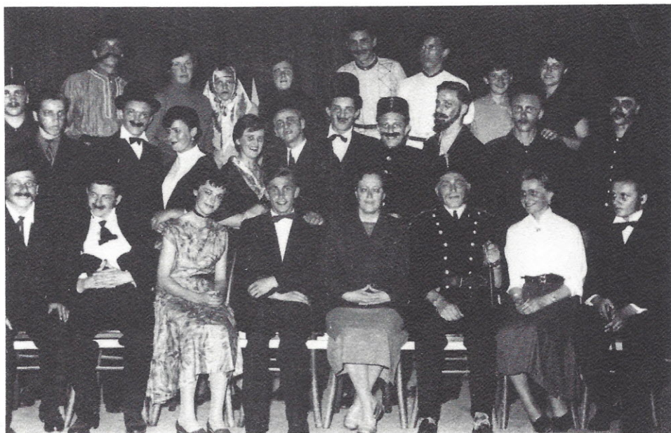
Po uprizoritvi Gogoljevega Revizorja 1955/56