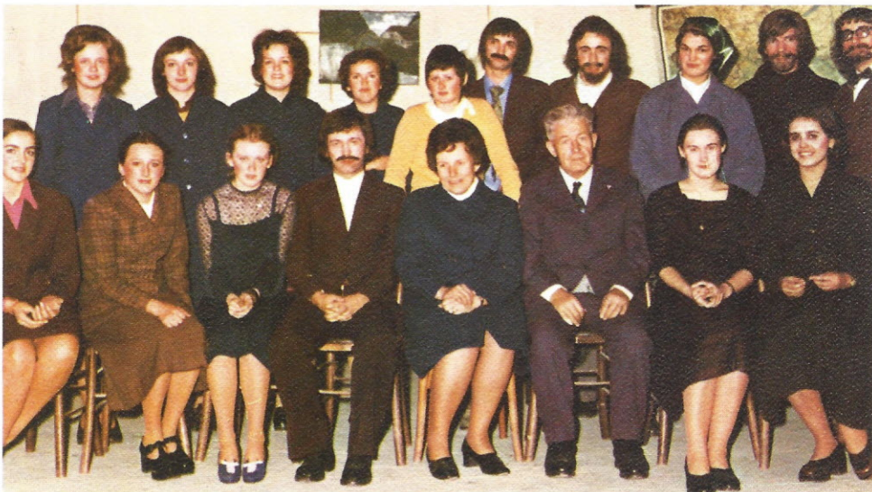
Spominski posnetek ob uprizoritvi Fodorjeve Mature 1972/73