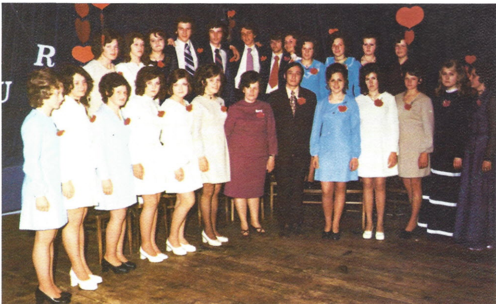
Maturantski večer 1973