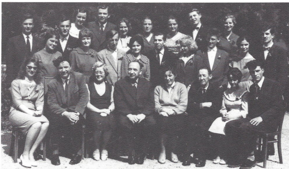
Maturanti s svojimi profesorji v šolskem letu 1960/61